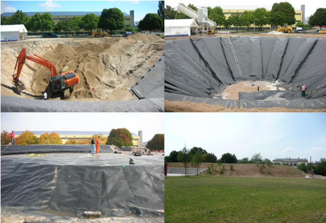
Figur 3: Fra tanklager til en bakke. München, DE (Soerensen et. al 2015).